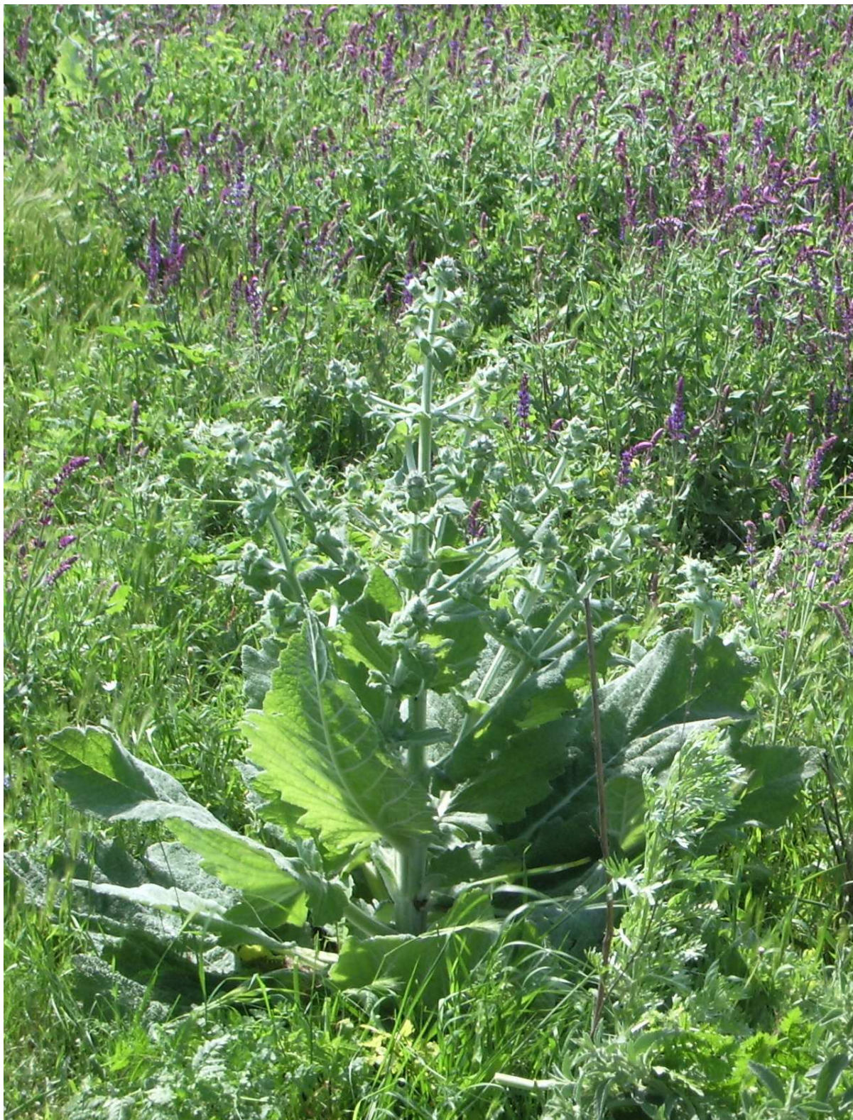
Рис. 1. Salvia aethiopsis в степовому різотрав'ї степових схилів Північного Причорномор'я (третя декада травня 2006 р.).