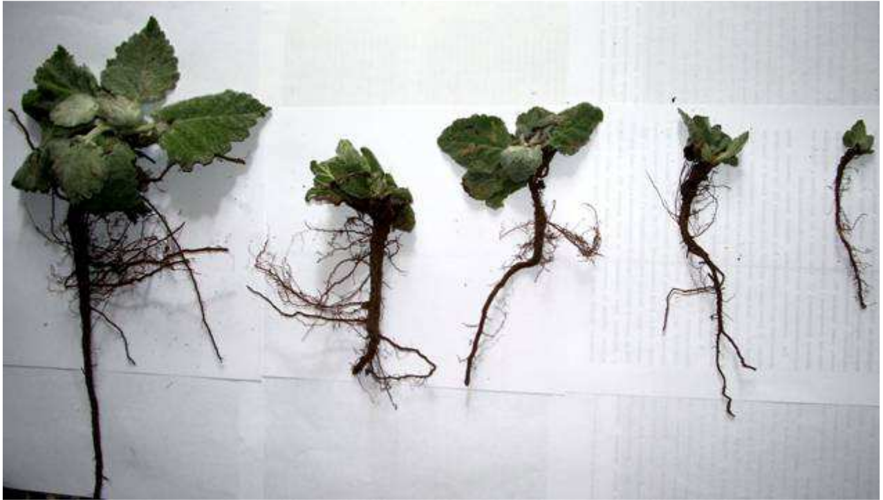
Рис. 3. Особини Salvia aethiopsis на різних стадіях розвитку (перша декада квітня 2006 р.).