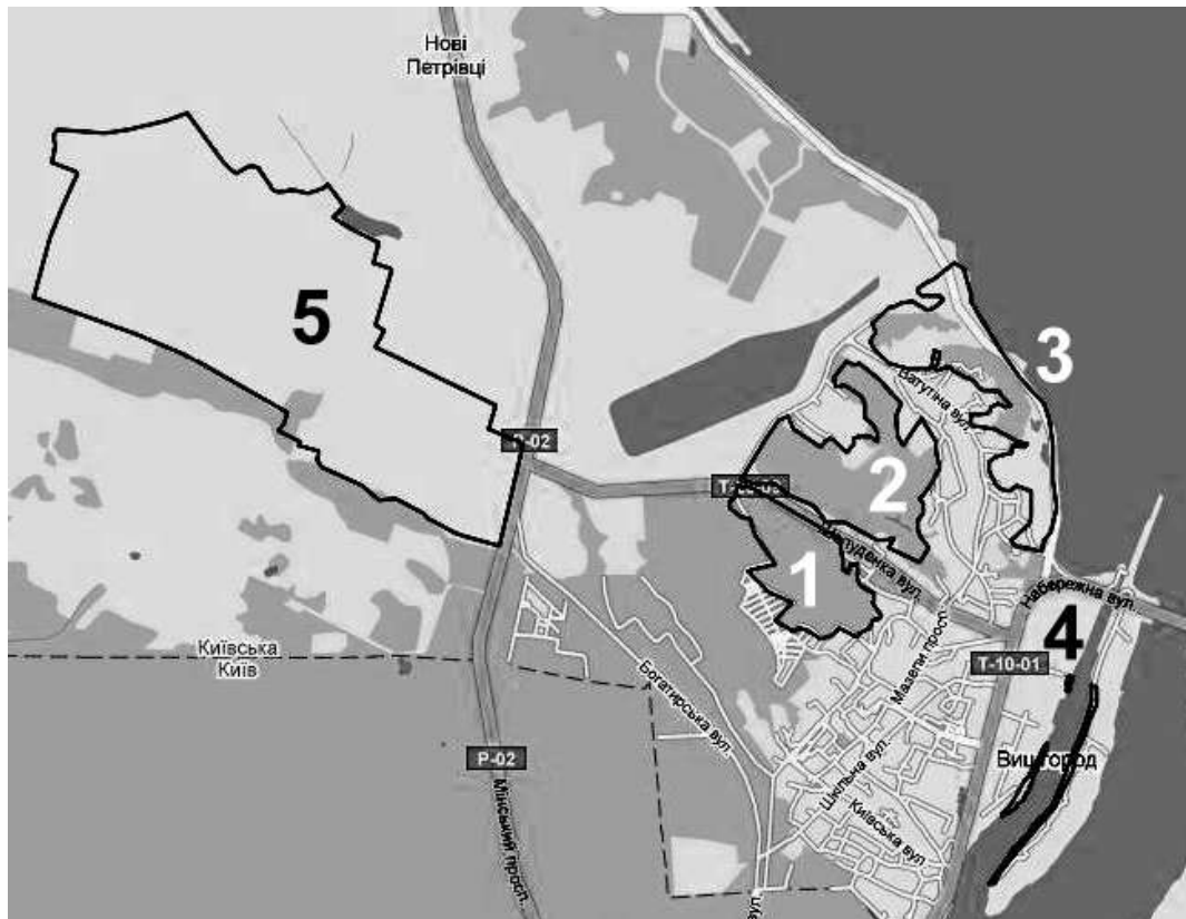
Рис. 1. Схема розташування досліджених осередків поширення рідкісних видів рослин м. Вишгорода та його околиць: 1. Система Сільського яру, 2. Система Горянського яру, 3. Схили Вишгородських круч та заплава біля їх підніжжя, 4. Ділянка осокового лісу неподалік виходу зі шлюзу КГЕС, 5. Вишгородський полігон.