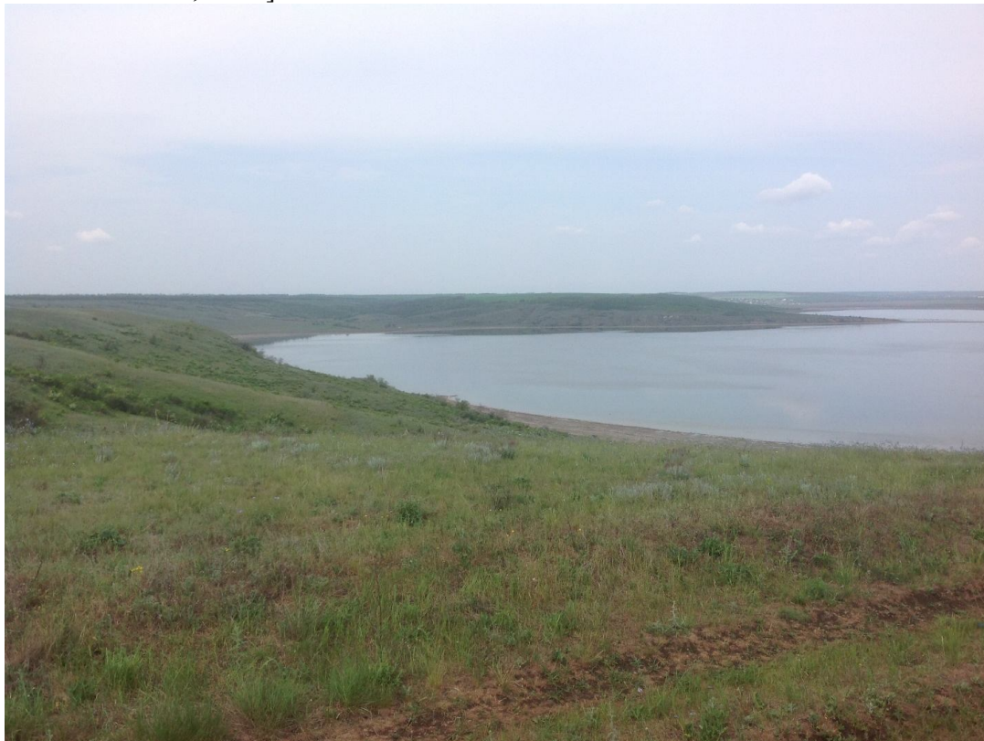
Рис. 1. Ландшафти Тилігульського лиману.

берегах збереглися залишки чагарникових, різнотравно-типчаково-ковилових та типчаково-ковилових степів [SHELYAG-SOSONKO, KOSTYLYOV, 1981]. Тилігульський лиман належить до Одеської групи Чорноморських лиманів напівзакритого типу та розташований у степовій зоні України на межі Миколаївської й Одеської областей [VODNO-BOLOTNI ..., 2006].